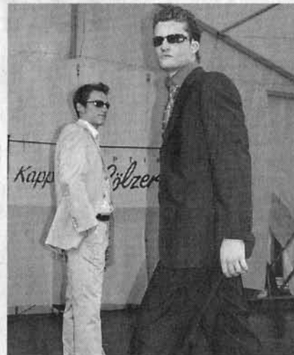
Alles was die Models trugen, gibt es auch in Markdorf zu kaufen.

Dass nicht jeder die Formen der attraktiven Models aufweise, spielte angesichts des Angebots in der Gehrenbergstadt, das alle Größen, alle Formen und alle Farben bereithalte, keine Rolle: „Schön ist man, wenn man sich schön fühlt“. Und dafür wird in Markdorf alles getan. Eleganz, Sportlichkeit, Chic und auch Kostengünstiges wurde perfekt auf den Laufsteg gebracht. Auch Accessoires und Brillen, Frisuren und Schuhe standen im Blickpunkt. Das Team „SpecialMix“ ließ während einer eineinhalbstündigen Show keine Langeweile zu. Zau-